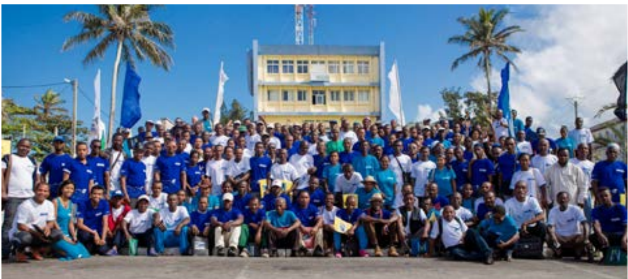
Jukwaa la Kitaifa MIHARI 2017

Maeneo ya hifadhi ya jadi ambayo yanatawaliwa na kusimamiwa na jamii wakati mwingine huwa na hadhi maalum kama 'jamii ya maeneo yaliyohifadhiwa/yaliyohifadhiwa'. Yanaweza kujumuisha misitu, maziwa, nyanda za malisho, mabonde ya maji, mikoko, maeneo baharini au mali ya kitamaduni ya pamoja katika maeneo ya hifadhi ya jadi, kulingana na sheria ya Kimalagasi iitwayo GELOSE (kiuhalisia: sheria ya Kulinda Usimamizi wa Mitaa). Wakati mwingine ni sehemu ya maeneo hifadhi kubwa ya bahari au ya nchi kavu inayoendeshwa na serikali. Mkataba wa kawaida wa GELOSE huhamisha mamlaka ya usimamizi kwa VOI (shirika rasmi la jamii) kwa muda mfupi na inaambatana na ramani za ardhi na rasilimali yake. Mpango rahisi wa maendeleo na