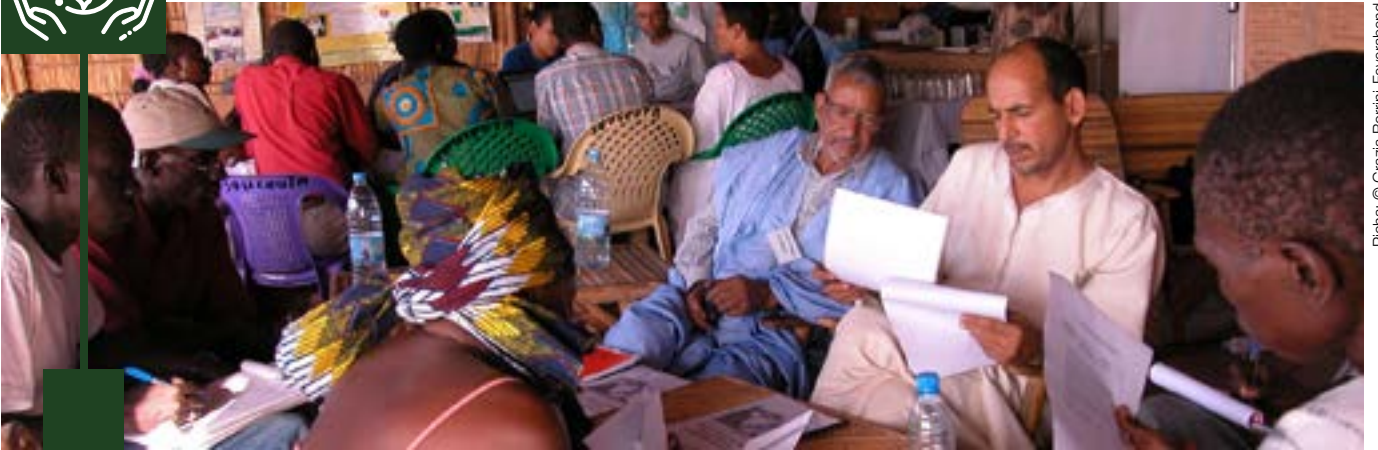
Ficha: © Grazia Borini-Feyerabend